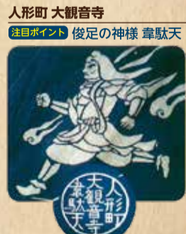
人形町 大観音寺 ※注目ポイント 俊足の神様 韋駄天