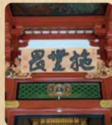
浅草 金龍山 浅草寺 ※注目ポイント 施無畏(せむい)

江戸三十三観音霊場とは、東京都内にある観音札所をめぐるお遍路コースです。浅草には1番札所の「浅草寺」と2番札所の「清水寺」、人形町には3番札所の「大観音寺」があります。秋の散策として霊場巡りを楽しんではいかが!?